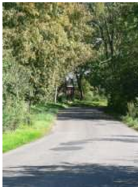
Infrastruktura drogowa w miejscowości Łęczyca, Łęczyca 17 – stan istniejący

Inwestycja przewiduje budowę chodnika wraz z montażem oświetlenia ulicznego, na długości 150 mb w miejscowości Łęczyca, prowadzącego do kościoła.