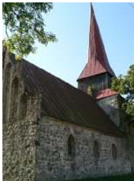
Kościół pw. Ofiarowania NMP w miejscowości Łęczycza – stan istniejący

Realizacja inwestycji przewiduje poprawę stanu obiektu, stanowiącego jedno z centralnych miejsc wsi tj. kościoła parafialnego pw. Ofiarowania NMP w Łęczyczy.