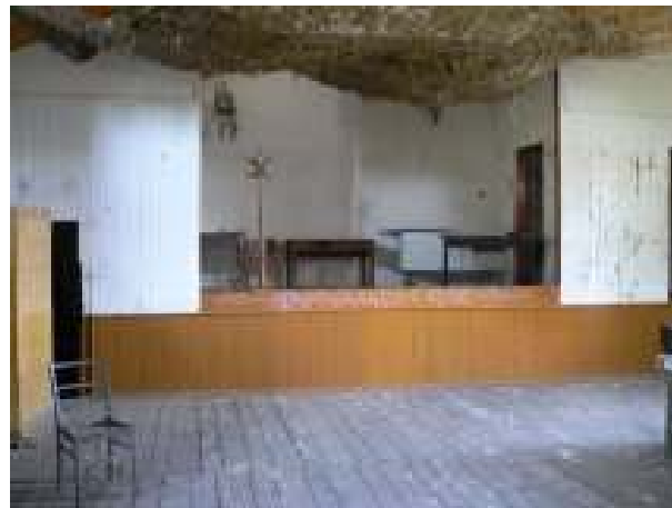
Świetlica wiejska w miejscowości Łęczycza – aktualny stan techniczny

Inwestycja ma na celu remont oraz doposażenie świetlicy wiejskiej w miejscowości Łęczycza. Zadanie obejmuje m.in. remont elewacji, wnętrza, dachu, stolarki okiennej i drzwiowej, zakup podstawowego wyposażenia oraz budowę parkingu poprzez utwardzenie terenu przed obiektem świetlicy.