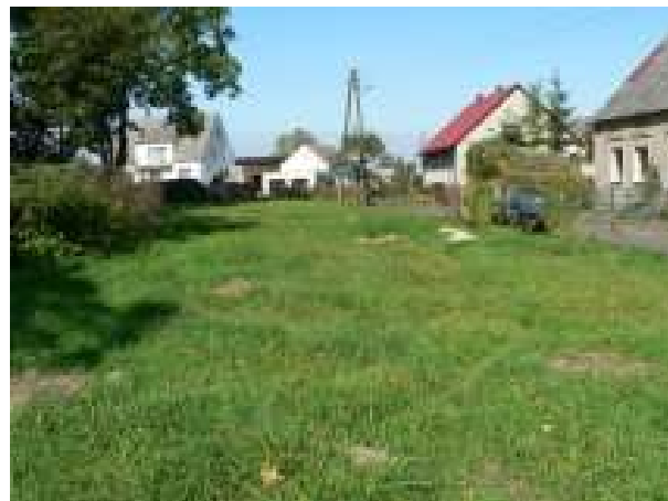
Działka nr 133 w miejscowości Łęczyca – stan istniejący

Realizacja zadania przewiduje budowę i wyposażenie placu zabaw w Łęczycy.