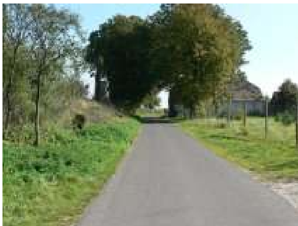
Infrastruktura drogowa w miejscowości Łęczyca, Łęczyca 32 – stan istniejący

Realizacja inwestycji przewiduje budowę chodnika wraz z montażem oświetlenia ulicznego, na długości 100 mb w miejscowości Łęczyca.