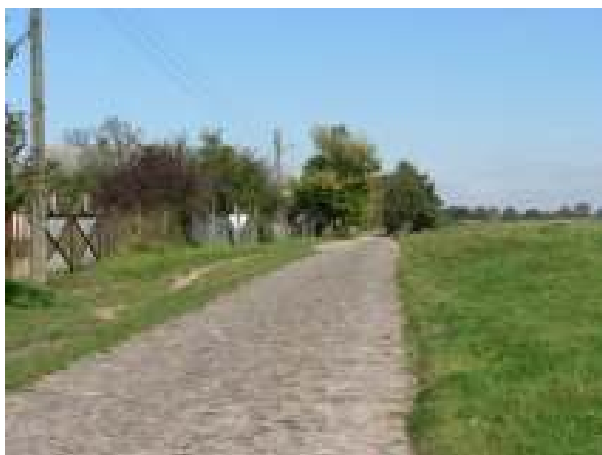
Droga brukowa gminna, Łęczyca - Łęczówka – aktualny stan techniczny

Realizacja inwestycji przewiduje gruntowną poprawę stanu technicznego drogi gminnej oraz budowę chodnika wraz z montażem oświetlenia, łączącego centrum wsi z zabudowaniami mieszkalnymi Kolonii Łęczówka.