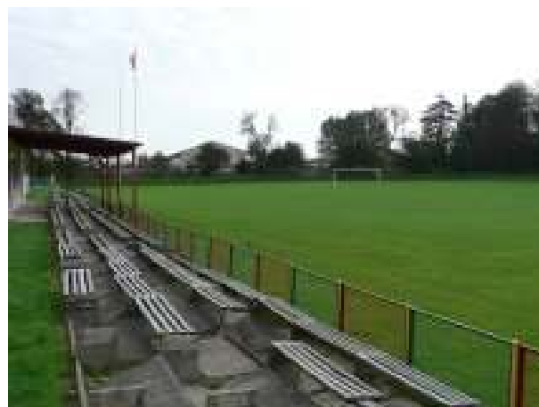
Stadion w miejscowości Stara Dąbrowa – aktualny stan techniczny

Realizacja zadania przewiduje zakup i montaż oświetlenia murawy stadionu, wykonanie remontu zaplecza, podstawy dla trybun i położenie siedzisk drewnianych dla widzów przy boisku sportowym w Starej Dąbrowie.