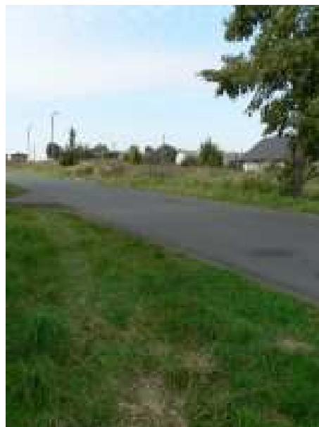
Droga Kicko – Białuń – istniejąca infrastruktura

Istniejący układ komunikacyjny nie zapewnia bezpieczeństwa publicznego. Realizacja inwestycji przewiduje budowę chodnika z kostki betonowej typu "polbruk" na odcinku 200mb.