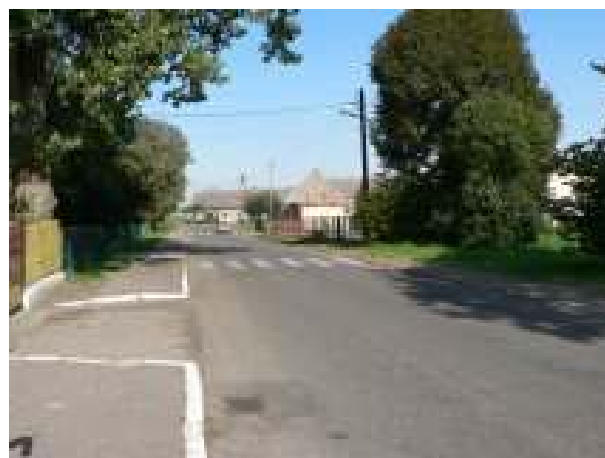
Chodnik przy Gimnazjum w miejscowości Stara Dąbrowa – stan faktyczny