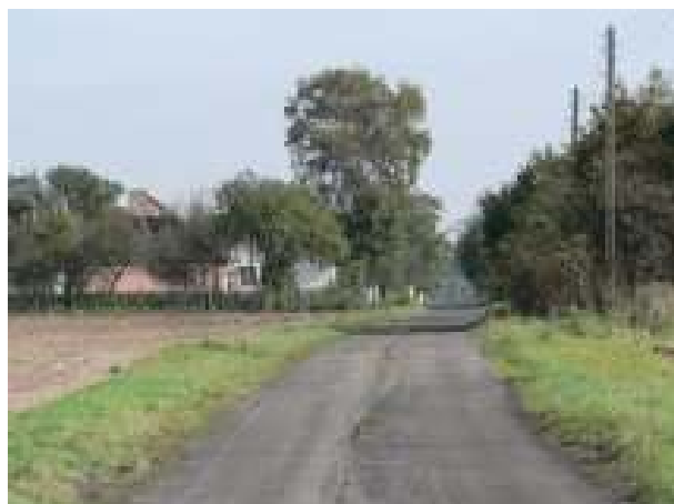
Gminna droga gruntowa w Kolonii – Stara Dąbrowa – aktualny stan techniczny

W ramach projektu przewiduje się zakup i montaż oświetlenia ul. w Kolonii Stara Dąbrowa. Brak oświetlenia wpływa negatywnie na bezpieczeństwo ruchu pieszego i kołowego. Realizacja zadania ma na celu poprawę bezpieczeństwa mieszkańców Kolonii.