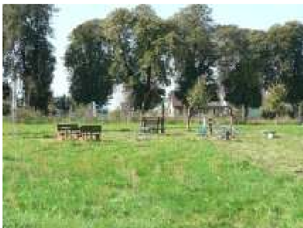
Plac zabaw dla dzieci w Starej Dąbrowie - aktualny stan techniczny

Realizacja zadania przewiduje przebudowę i wyposażenie placu zabaw w Starej Dąbrowie. Zagospodarowanie terenu zabaw urządzeniami (huśtawki, bujaki, równoważnie, przeplotnie, „willa”) dostosowanymi do wieku i możliwości rozwojowych dziecka w naturalny sposób stwarza dobre warunki dorosłym do sprawowania opieki nad bawiącym się dzieckiem. Konsekwencją wdrożenia projektu będzie poprawa bezpieczeństwa dzieci podczas gier i zabaw.