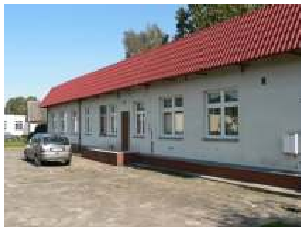
Gminne Centrum Kultury w Starej Dąbrowie – stan obecny obiektu

Projekt zakłada rozbudowę obiektu Gminnego Centrum Kultury w miejscowości Stara Dąbrowa o dodatkowe pomieszczenie.