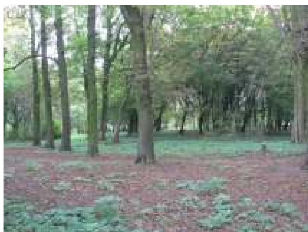
Park przy boisku w miejscowości Stara Dąbrowa – stan obecny

Realizacja zadania przewiduje rewitalizację i zagospodarowanie terenu parku przy boisku w miejscowości Stara Dąbrowa. W ramach projektu planuje się utworzenie ścieżek spacerowych, montaż oświetlenia, ławek.