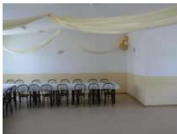
Pomieszczenia Gminnego Centrum Kultury w Starej Dąbrowie – stan istniejący