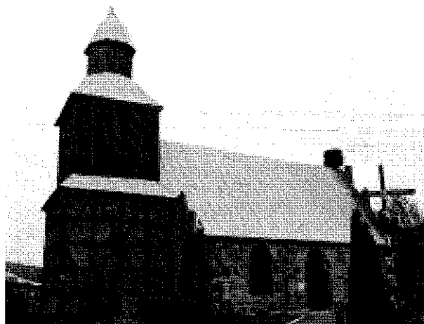
Kościół filialny p.w. Matki Boskiej Pocieszenia z wieżą (widok z zewnątrz) – aktualny stan techniczny.