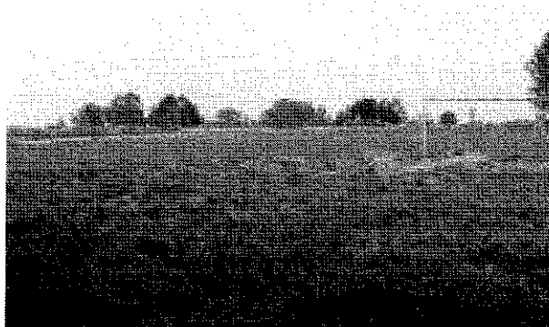
Teren pod budowę kompleksu sportowo-kulturalnego – aktualny stan techniczny.