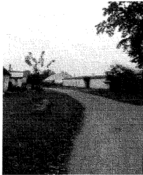
Istniejący stan drogi – aktualny stan techniczny.

Projekt zakłada modernizację drogi na odcinku Nowa Dąbrowa 29 - 39.