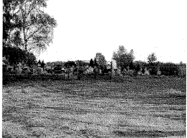
Teren parkingu przy cmentarzu w miejscowości Nowa Dąbrowa - aktualny stan techniczny.

Inwestycja ma służyć poprawie stanu słabo rozwiniętej infrastruktury publicznej, jak również dodatkowo zaspokajać potrzeby mieszkańców, w szczególności związane z regularnymi obrzędami religijnymi.