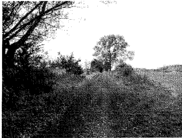
Droga dojazdowa do pól - aktualny stan techniczny.

Realizacja zadania zakłada zbudowanie drogi dojazdowej do pól, położonej w odległości 3 km od boiska, w miejscowości Nowa Dąbrowa.