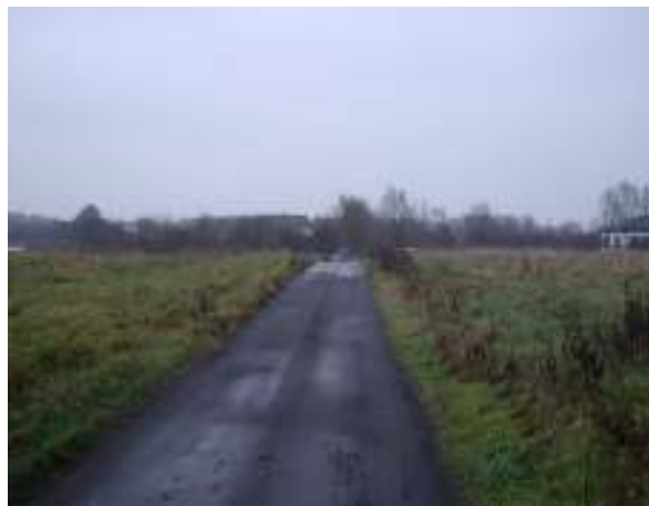
Droga gminna łącząca centrum Parlina z jeziorem – stan obecny