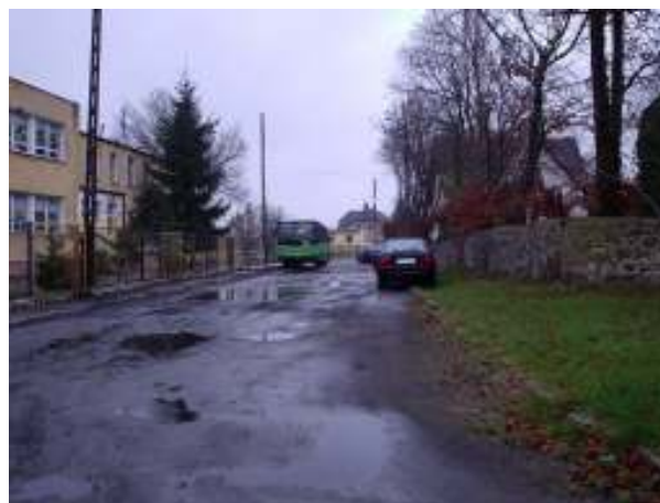
Droga gminna łącząca szkołę z centrum wsi Parlino – stan istniejący

Realizacja inwestycji przewiduje gruntowną poprawę stanu technicznego drogi gminnej oraz chodnika, łączącego centrum wsi ze szkołą podstawową im. Marii Konopnickiej w Parlinie.