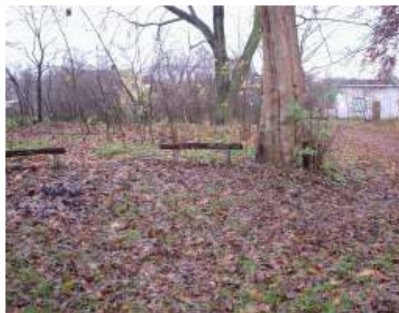
Park w Parlinie – stan istniejący

Realizacja inwestycji przewiduje gruntowną poprawę infrastruktury publicznej na terenie parku w Parlinie.