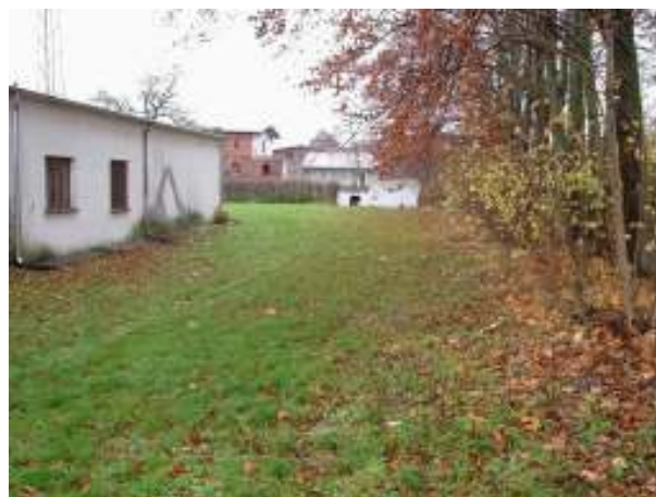
Otoczenie świetlicy wiejskiej w Parlinie – stan obecny

Inwestycja przewiduje budowę drogi dojazdowej oraz parkingu usytuowanego na terenie świetlicy wiejskiej wraz z montażem oświetlenia, w miejscowości Parlino.