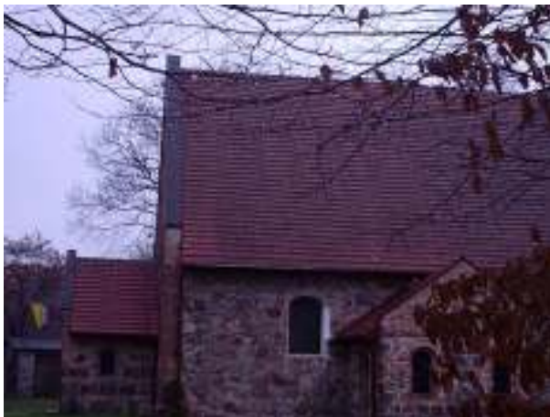
Kościół p.w. Miłosierdzia Bożego w miejscowości Parlino – stan istniejący

Realizacja inwestycji przewiduje poprawę stanu obiektu, stanowiącego jedno z centralnych miejsc wsi tj. kościoła parafialnego p.w. Miłosierdzia Bożego w Parlinie.