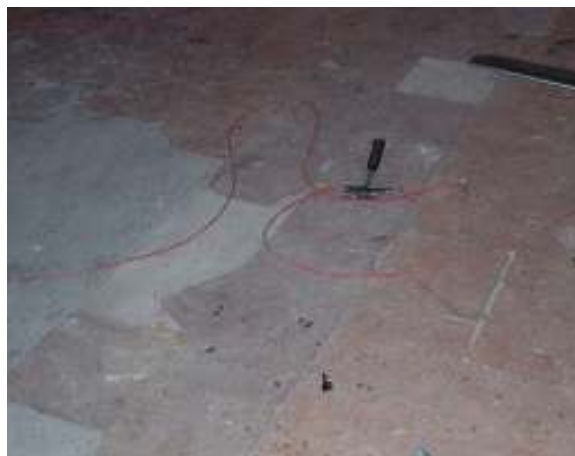
Świetlica wiejska w miejscowości Parlino – aktualny stan techniczny

Inwestycja ma na celu remont oraz doposażenie świetlicy wiejskiej w miejscowości Parlino. Zadanie obejmuje m.in. remont podłogi, stolarki drzwiowej, zaplecza socjalnego, budowę kominka oraz zakup podstawowego wyposażenia świetlicy.