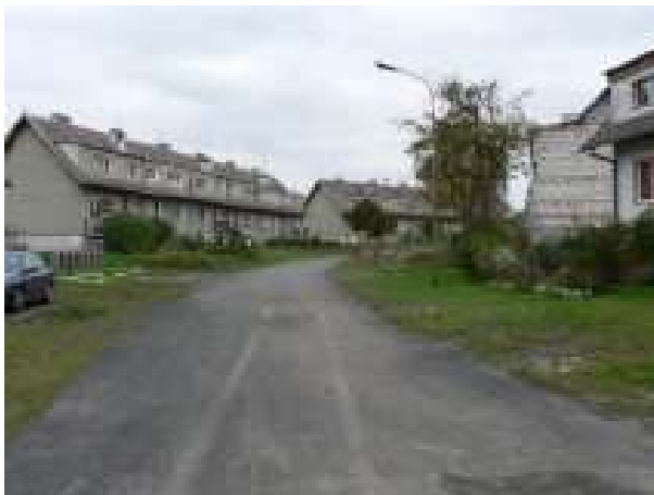
Miejsce lokalizacji chodnika – aktualny stan techniczny.

Realizacja inwestycji przewiduje budowę chodnika z kostki betonowej typu „polbruk” na odcinku 400 mb. Istniejący stan techniczny pobocza drogi nie zapewnia wystarczającego bezpieczeństwa mieszkańcom Chlebowa. Konsekwencją wdrożenia projektu będzie poprawa ruchu kołowego i funkcjonalności ruchu pieszego, a także poprawa estetyki przestrzeni, jak również zwiększenie bezpieczeństwa mieszkańców Chlebowa.