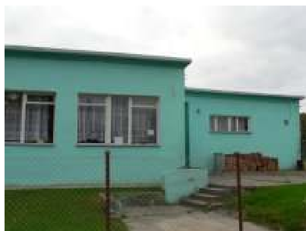
Stan istniejący świetlicy wiejskiej – widok z zewnątrz, aktualny stan techniczny.