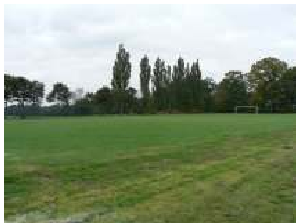
Teren pod budowę parkingu przy boisku – aktualny stan techniczny.

Projekt zakłada budowę parkingu przy boisku w miejscowości Chlebowo.