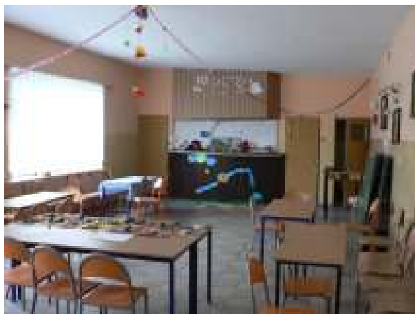
Stan istniejący świetlicy wiejskiej – widok od wewnątrz, aktualny stan techniczny.

Realizacja zadania przewiduje modernizację świetlicy wiejskiej. W ramach projektu planuje się remont dachu, podłączenie świetlicy do centralnego ogrzewania, wymianę stolarki okiennej i drzwiowej. Realizacja inwestycji doprowadzi do podniesienia standardów i warunków funkcjonowania świetlicy. Inwestycja ma na celu zaspokojenie społecznych i kulturalnych potrzeb lokalnej młodzieży oraz zwiększenie potencjału świetlicy wiejskiej, jako lokalnego ośrodka rozwoju kultury i edukacji w miejscowości Chlebowo.