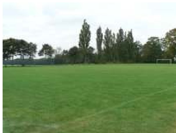
Teren pod budowę boiska gminnego – aktualny stan techniczny.

Projekt zakłada rozbudowę gminnego boiska wraz z „małą” infrastrukturą. W ramach inwestycji przewiduje się ustawienie ławeczek oraz instalację oświetlenia na terenie boiska. Inwestycja przewiduje zbudowanie lokalnej infrastruktury sportowo – rekreacyjnej i w konsekwencji podniesienie aktywności sportowej mieszkańców oraz umożliwienie organizacji imprez kulturalno – sportowych o zasięgu lokalnym i ponadlokalnym.