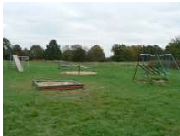
Teren placu zabaw przy boisku – aktualny stan techniczny.

Inwestycja zakłada przebudowę istniejącego placu zabaw. Realizacja projektu przewiduje wymianę zdevaluowanych urządzeń na nowe (huśtawki, bujaki, przeplotnie, „zamek”), które będą dostosowane do wieku dzieci i będą bezpieczne w użyciu.