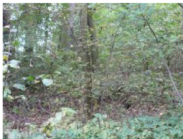
Wejście do parku naturalistycznego – aktualny stan techniczny.

Realizacja inwestycji przewiduje renowację i zagospodarowanie parku naturalistycznego.