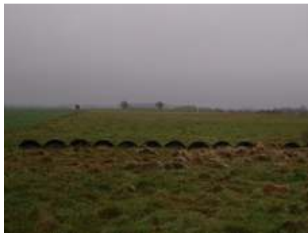
Boisko w miejscowości Kicko – stan istniejący

Realizacja inwestycji przewiduje poprawę stanu infrastruktury sportowej w miejscowości Kicko. Obecny poziom zagospodarowania tego terenu nie zaspokaja potrzeb związanych z rozwojem fizycznym mieszkańców.