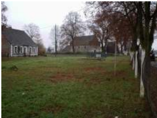
Teren pod budowę placu zabaw dla dzieci w miejscowości Kicko - aktualny stan techniczny

Realizacja zadania przewiduje budowę i wyposażenie placu zabaw w miejscowości Kicko.