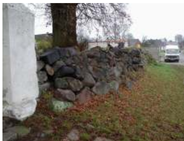
Teren pod parking – stan obecny