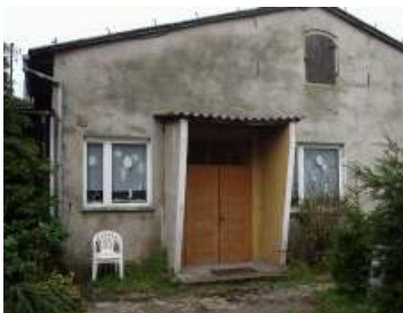
Świetlica wiejska – istniejący stan techniczny