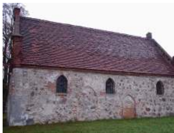
Kościół p.w. Matki Boskiej Częstochowskiej w miejscowości Kicko – aktualny stan techniczny

Realizacja inwestycji przewiduje poprawę stanu obiektu, stanowiącego jedno z centralnych miejsc wsi tj. kościoła filialnego p.w. Matki Boskiej Częstochowskiej w miejscowości Kicko.