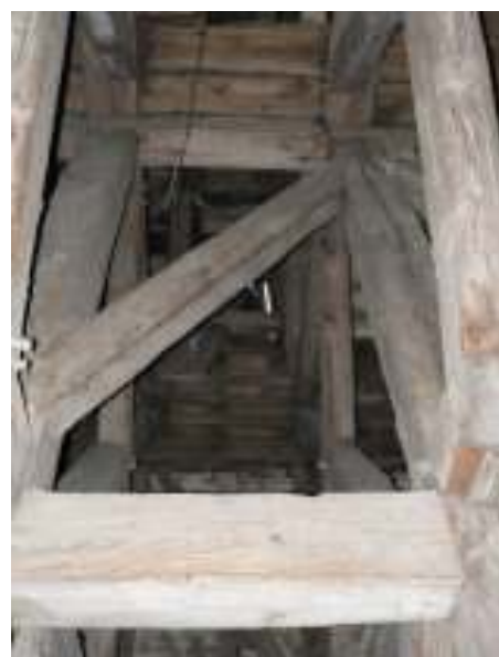
Stan istniejący schodów na wieżę – widok od wewnątrz, aktualny stan techniczny.