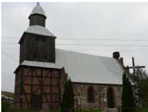
Kościół filialny p.w. Matki Boskiej Pocieszenia z wieżą (widok z zewnątrz) – aktualny stan techniczny.