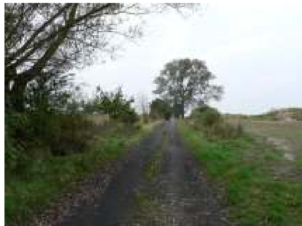
Droga dojazdowa do pól - aktualny stan techniczny.

Realizacja zadania zakłada zbudowanie drogi dojazdowej do pól, położonej w odległości 3 km od boiska, w miejscowości Nowa Dąbrowa.