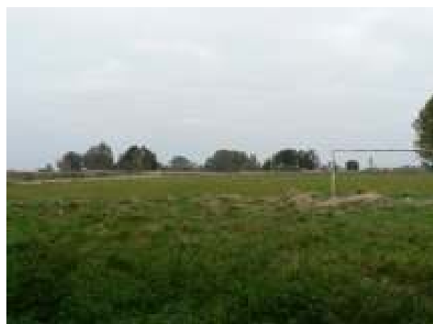
Teren pod budowę kompleksu sportowo-kulturalnego – aktualny stan techniczny.