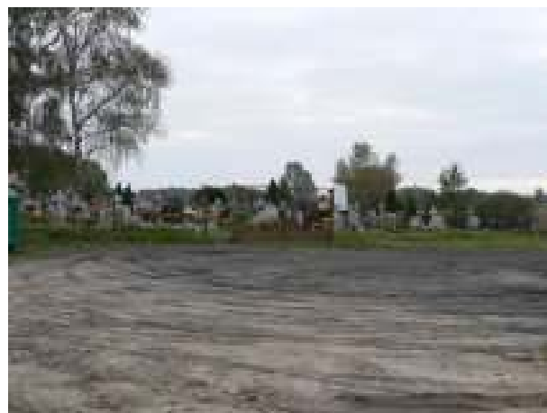
Teren parkingu przy cmentarzu w miejscowości Nowa Dąbrowa - aktualny stan techniczny.

Inwestycja ma służyć poprawie stanu słabo rozwiniętej infrastruktury publicznej, jak również dodatkowo zaspokajać potrzeby mieszkańców, w szczególności związane z regularnymi obrzędami religijnymi.