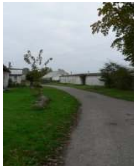
Istniejący stan drogi – aktualny stan techniczny.