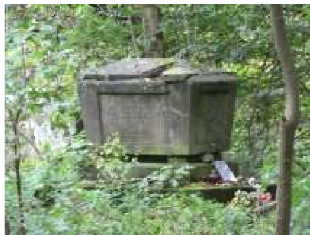
Park naturalistyczny wraz z zachowaną nekropolią rodową – aktualny stan techniczny.

Projekt zakłada zagospodarowanie parku naturalistycznego w miejscowości Nowa Dąbrowa poprzez odtworzenie ścieżek parkowych, montaż ławeczek i oświetlenia.